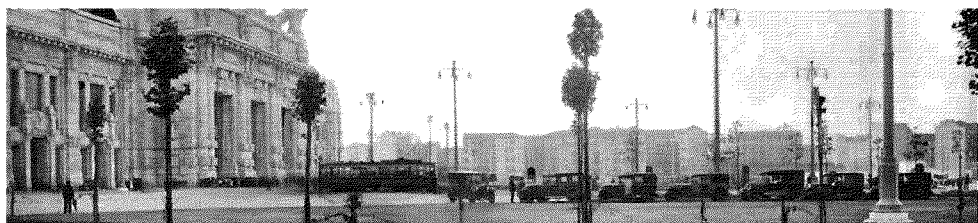
Com'era Milano. Piazza Duca d'Aosta negli anni '30, in una storica fotografia della Fondazione Dalmine; sotto, uno scatto proveniente dell'archivio storico Eni