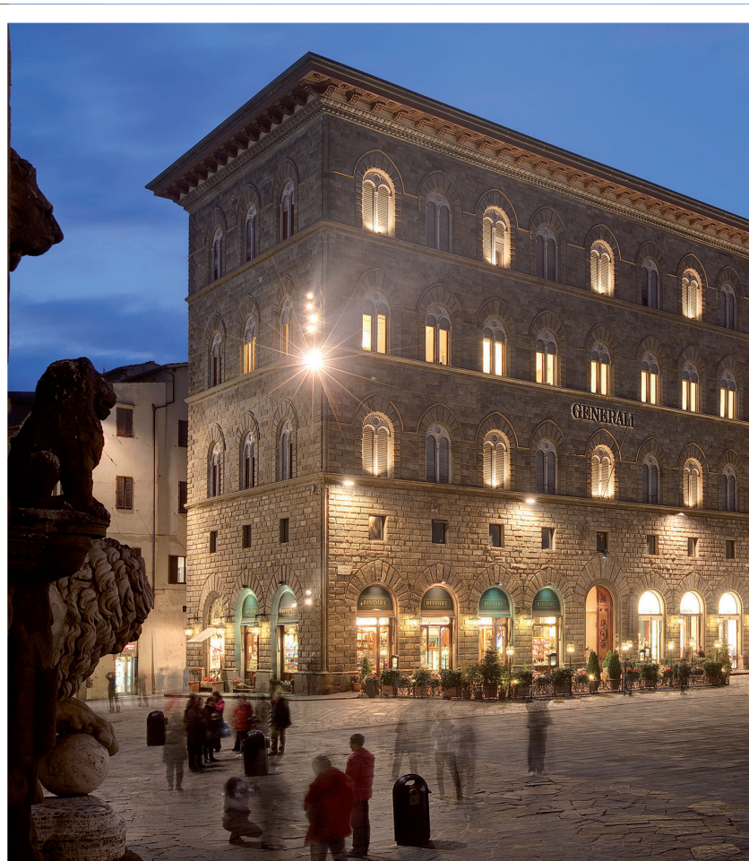
Palazzo del Leone - Piazza della Signoria, 4

Progetti , società specializzata di engineering per la realizzazione di complessi civili ed industriali, con uffici a Firenze e Milano. Gli spazi office si presentano con soluzioni di arredo custom realizzati da SAGSA, gli impianti illuminotecnici sono stati affidati a TARGETTI. Integrati nel Palazzo del Leone, si trovano i più moderni sistemi tecnologici e di impiantistica di ultima generazione, con spazi interamente cablati ed estremamente versatili , così da